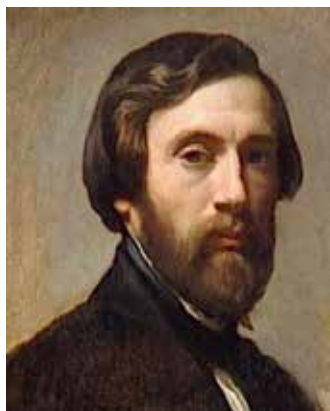
Charles Gleyre autoportrait

Charles Gleyre, né en 1806 à Chevilly (canton de Vaud) et mort en 1874 à Paris, est un peintre suisse, qui enseigna essentiellement son art à Paris. Il expose Le Soir , plus tard appelé Les Illusions Perdues , au Salon de 1843. Peintre au dessin irréprochable, Charles Gleyre annonce les artistes symbolistes par la poésie de cette œuvre aux teintes irréelles. L'œuvre rencontre un vif succès au Salon et fera son entrée au Louvre.