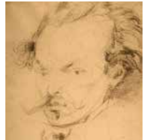
Charles Bargue autoportrait présumé

L'œuvre que vous avez entre les mains est une impression d'art traditionnelle de la planche N° 22 du célèbre cours de dessin de Charles Bargue. Cette planche lithographiée est l'interprétation du tableau «Une mère et son enfant» d'Auguste Toulmouche, faisant partie de la section «Modèles d'après les Maîtres» du cours conçu par Jean-Léon Gérôme, professeur à l'École des Beaux-Arts de Paris. Il confia la réalisation des dessins servant de modèles pour ce cours à Charles Bargue, le meilleur de ses disciples tandis que la maison Goupil allait en assurer l'édition et la diffusion.